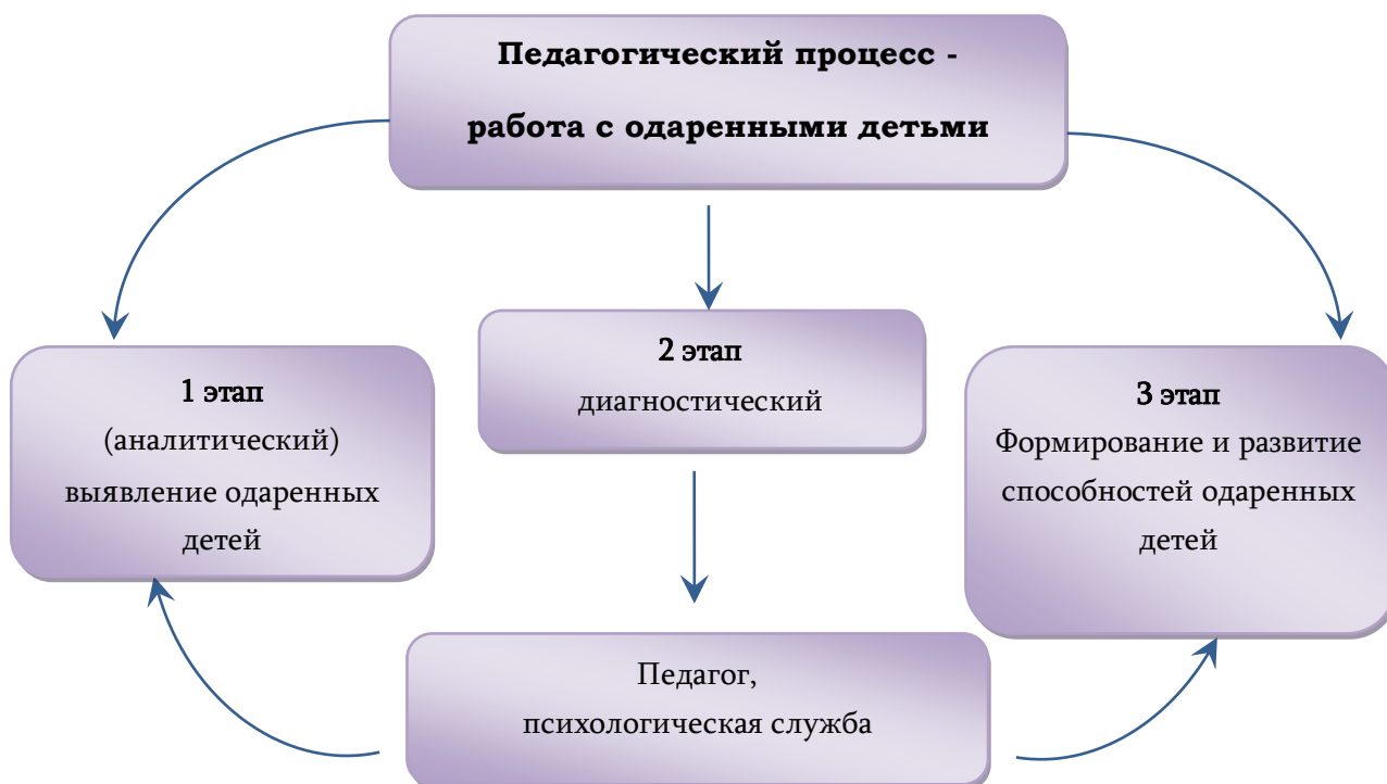
Рисунок 1 – Этапы работы со способными, одаренными и талантливыми детьми

3 этап: этап формирующий – формирование и развитие способностей одаренных и талантливых детей (рисунок 1).